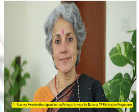
Dr. Soumya Swaminathan Appointed as Principal Adviser for National TB Elimination Programme

(B) हाल ही में डॉ. सौम्या स्वामीनाथन को राष्ट्रीय क्षय रोग उन्मूलन कार्यक्रम के लिए केंद्रीय स्वास्थ्य एवं परिवार कल्याण मंत्रालय में प्रमुख सलाहकार नियुक्त किया गया है। वे इस कार्यक्रम के लक्ष्यों को प्राप्त करने के लिए समग्र रणनीति पर तकनीकी सलाह देगी। डॉ. सौम्या स्वामीनाथन को एनटीईपी के लिए MoHFW का सलाहकार बनाया गया।