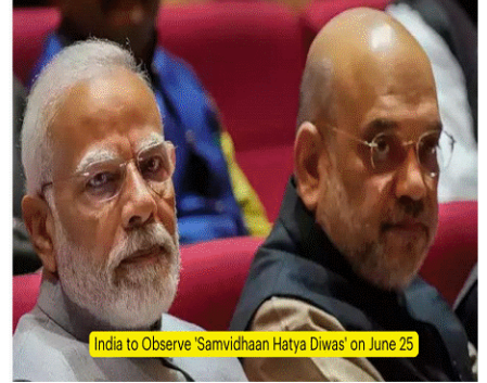
India to Observe 'Samvidhaan Hatya Diwas' on June 25

(C) केंद्र सरकार ने इमरजेंसी को याद करते हुए हर साल 25 जून को संविधान हत्या दिवस के तौर पर मनाने का फैसला लिया है। इस संबंध में केंद्र सरकार की ओर से नोटिफिकेशन जारी किया गया है। 28 जून 1975 को देश में इमरजेंसी लागू किया था। इस फैसले का उद्देश्य उन लाखों लोगों के संघर्ष का सम्मान करना है, उन्होंने तानाशाही सरकारी की असंख्य यातनाओं व उत्पीड़न का सामना करने के बावजूद लोकतंत्र को पुनर्जीवित करने के लिए संघर्ष किया।